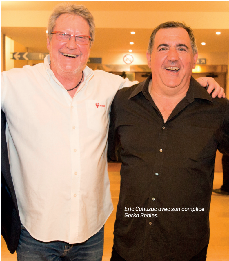
Éric Cahuzac avec son complice Gorka Robles.