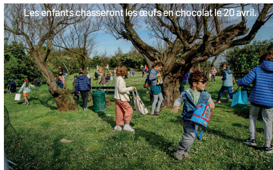
Les enfants chasseront les œufs en chocolat le 20 avril.