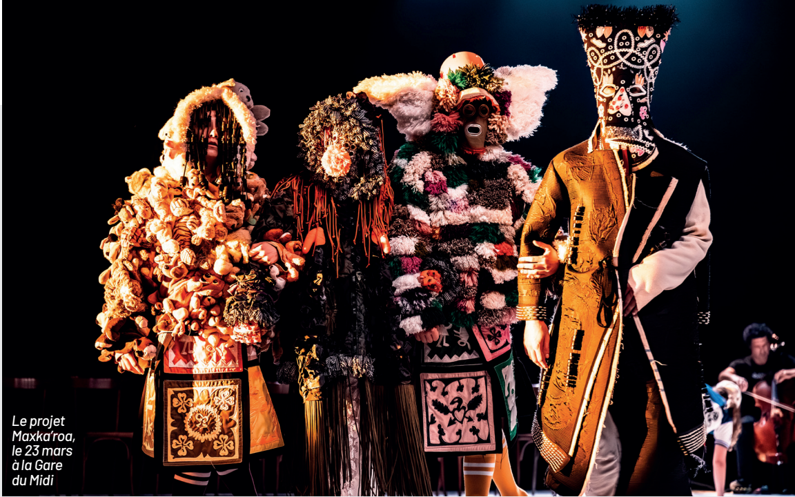
Le projet Maxka'roa, le 23 mars à la Gare du Midi