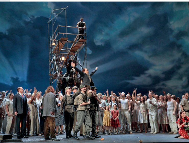
Fidelio , de Beethoven, le 15 mars à la Gare du Midi (retransmission du Met Opera).