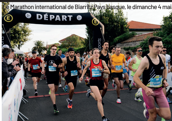
Le Marathon international de Biarritz Pays basque, le dimanche 4 mai.