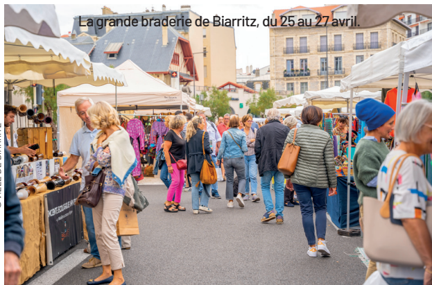
La grande braderie de Biarritz, du 25 au 27 avril.